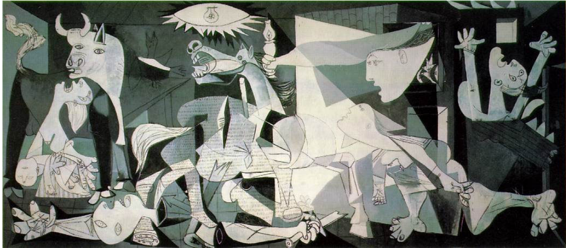
پیکاسو . تابلوی شهری گرینیکا

سە دەدی تازه پره لەم دژله گه له قوولانه . بیه کگرتوویی روانگهی ژیان ئه وهنده به توندی ده که ویتته مه ترسییه وه که لیکه لانه وه ده بیته مایه ی سهره کی و بابته بۆ خودی هونه ر. سورریالیسم که به قه ولی ئاندره بریتۆن ته نیا مه به سته چۆنیه تی زبان و به یانی شاعیرانه بوو ئیستا پووج بوونی ته وای بوونی مرۆف ده کاته بابته تی خۆی . دادائیسیم خه ریک گه رانه وه بۆ رۆمانتیسیمی رۆسۆیییه له توندترین شیوه دا . یانی ئه وان هیشتا ده یانه وئ نابه جی بکه نه به جی و له هه ست و بیری خۆبه خۆیی سیسته م پیک بینن . ده بی فرۆید ئاگی له م فریودانه ی سورریالیسته کان بووبی ، کاتیک له چاوپیکه وتنی له گه ل "سالوادۆر دالی" دا پپی گوتوو "ئه وه ی له هونه ره که ی تۆدا بۆ من سه رنج راکیشه ، نا ئاگایی نییه به لکوو ئاگاییه که یه " ئاخۆ فرۆید به م وته یه نه یو یستوو بلی " شیت