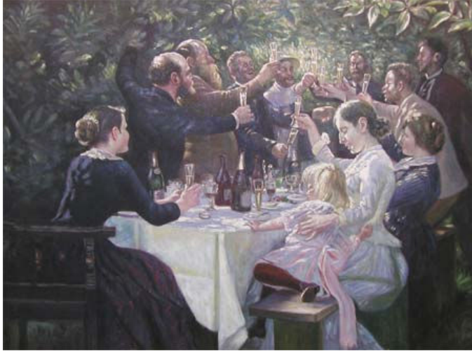
وان گۆگ (ئىمپىرىسئونىسم)

جوولانەوہی دواکەوتووی گەورەہی ئەم سەدە لە بواری ھۆنەردا خۆی لە لادانی ئىمپىرسىونىزمدا دەنوینى. راستە کە ھەموو کاتىک لە نیوان "فۆرمالیزم" و دژى فۆرمالیزمدا کىشەہی، بەرەو پىش و پاش، ھەبوو، بەلام لە سەدەکانى نىوہ راستەوہ ھەتا ئەم سەدە، بە ئەمەک بوون بۆ سروشت گومانى لىی نەدەکرا. لەم بوارەدا ئىمپىرسىونىزم سەرلوتکە و تەواوکەرى رەوتىکى چوارسەد سالى بوو. ھۆنەرى پاش ئىمپىرسىونىزم يەکەم ھۆنەرە کە بىرى راست بوونى فرى دەدا و روانگەہى