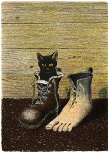
وان گۆگ (ئىمپىرىسئونىسم)

دیارە ئىمپىرسىونىزم گریدراوی رۆحى بە سروشتەوہ نوبوو، بۆ خۆی رىگاخۆشکەرى ئەم گۆرانکارىيە بوو.